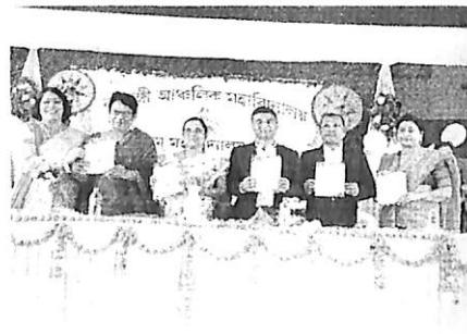
Inaugural event of Philosophy department's journal 'DRISTI', 2017