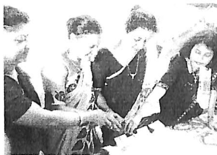
Cake cutting moment on Teacher's Day, 2017