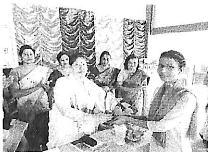
Receiving the 1 st Prize for best speech on Women's Day.