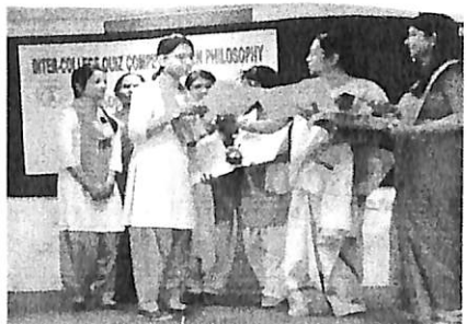
Receiving certificates from the teachers for participating quiz competition at Handique Girl's college.