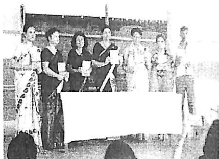
Inaugural event of the second edition of 'SVAJÑA', 2017