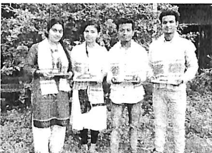
1 st Class achievers, 2017