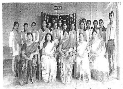
All the students and teachers of Philosophy department along with the principal on 'WORLD PHILOSOPHY DAY' event, 2017