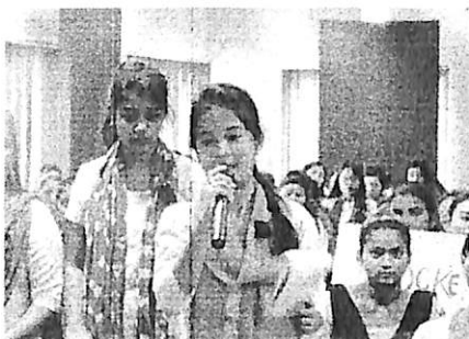
Participant of Inter College Quiz Competition of Philosophy.