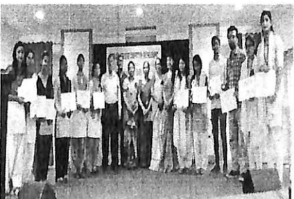
Along with the teachers and other students of other colleges of Guwahati.