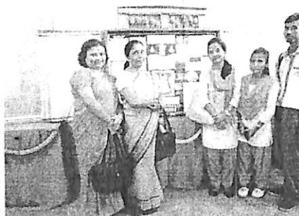
Along with the teachers, at wall magazine competition, 2017.