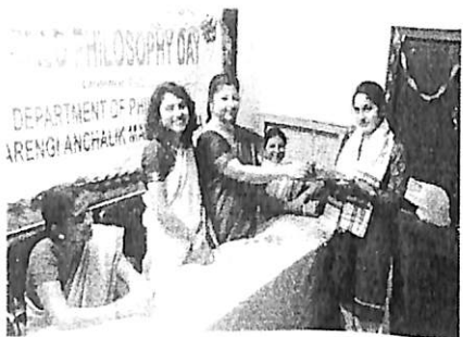
Receiving trophy for securing 1 st Class in 6th Sem. Final Examination.