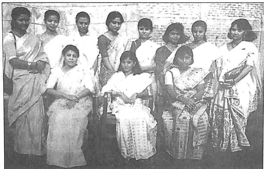
মহাবিদ্যালয়ত যোগদানৰ পিছত