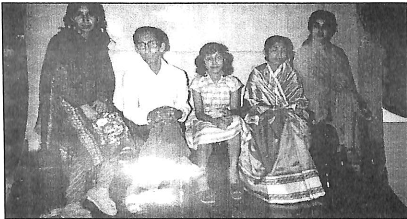
মাক দেউতাকৰ সৈতে