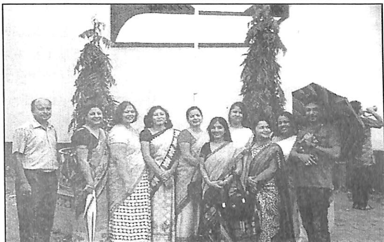
মহাবিদ্যালয়ত ১৫ আগষ্ট উদ্‌যাপনৰ এটা মুহূৰ্ত